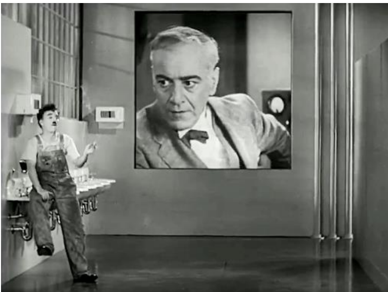
Imagem D2 – Charlie Chaplin, Tempos Modernos , 1936 (Filme).