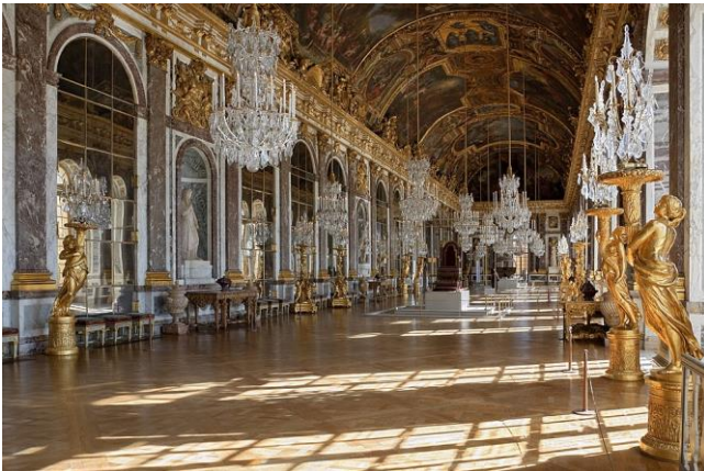
Imagem B1 - Palácio de Versalhes (França), Galeria dos Espelhos, Jules Hardouin-Mansart, 1678-1684.