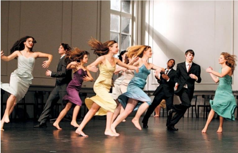
Imagem D3 - Pina Bausch, Kontakthof mit Teenagern ab '14' , 2008 (Dança, Teatro).