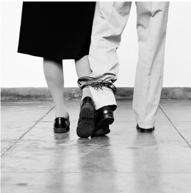
Imagem D4 – Helena Almeida, S/ título , 2010 (Fotografia).