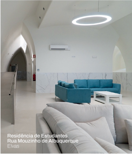
Residência de Estudantes Rua Mouzinho de Albuquerque Elvas