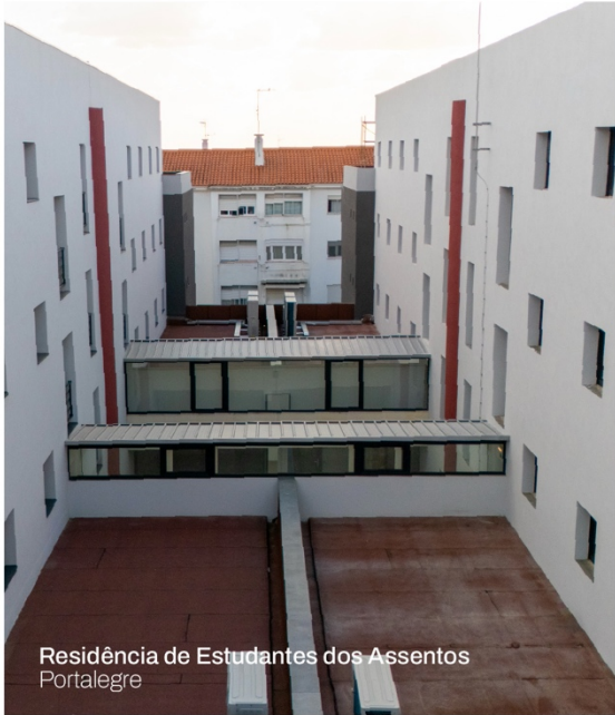
Residência de Estudantes dos Assentos Portalegre