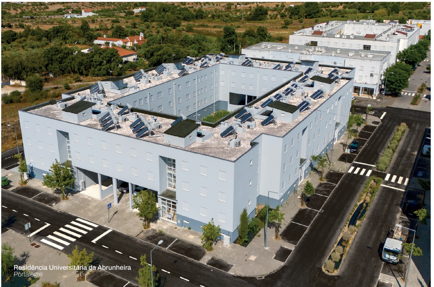
Residência Universitária da Abrunheira Portalegre