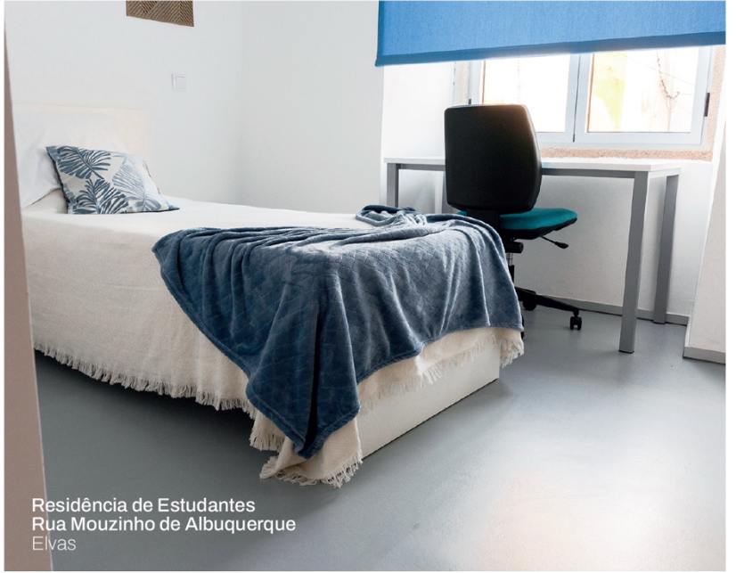
Residência de Estudantes Rua Mouzinho de Albuquerque Elvas