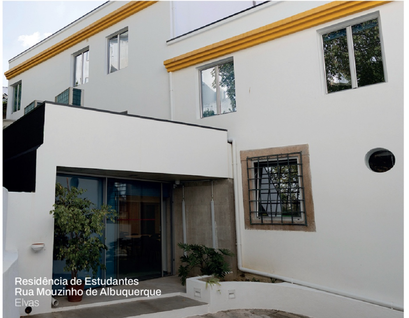
Residência de Estudantes Rua Mouzinho de Albuquerque Elvas